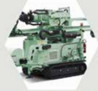
Fraste MultiDrill XL Series

تقوم FRASTE بتصنيع منصات الحفر الهيدروليكية منذ عام 1964، عندما كان مجال الحفر لا يزال تقليديا للغاية ويشارك بشكل أساسي في النقل الميكانيكي، وبالتالي كانوا بالتأكيد من بين الرواد الإيطاليين للحفر الحديث باستخدام الأنظمة الهيدروليكية على منصاتهم.