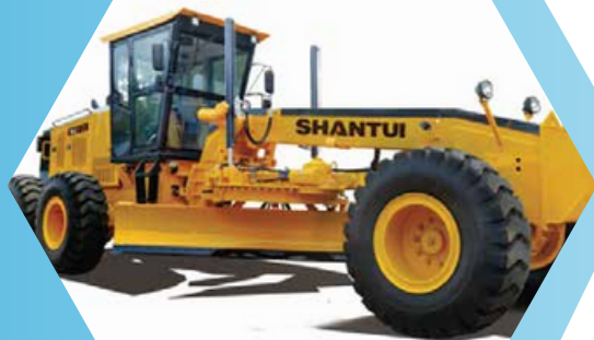
STANDARD MOTOR GRADER SG27- C5