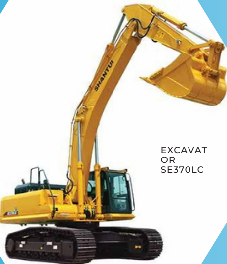
EXCAVAT OR SE370LC