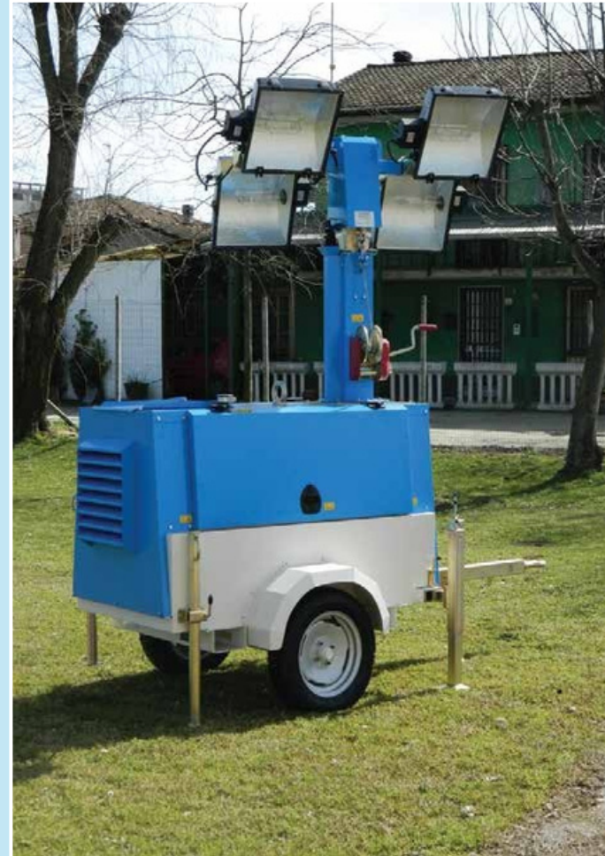
Special Lighting Tower