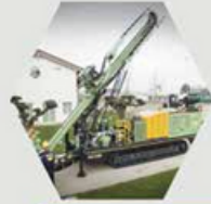
FRASTE MX SERIES