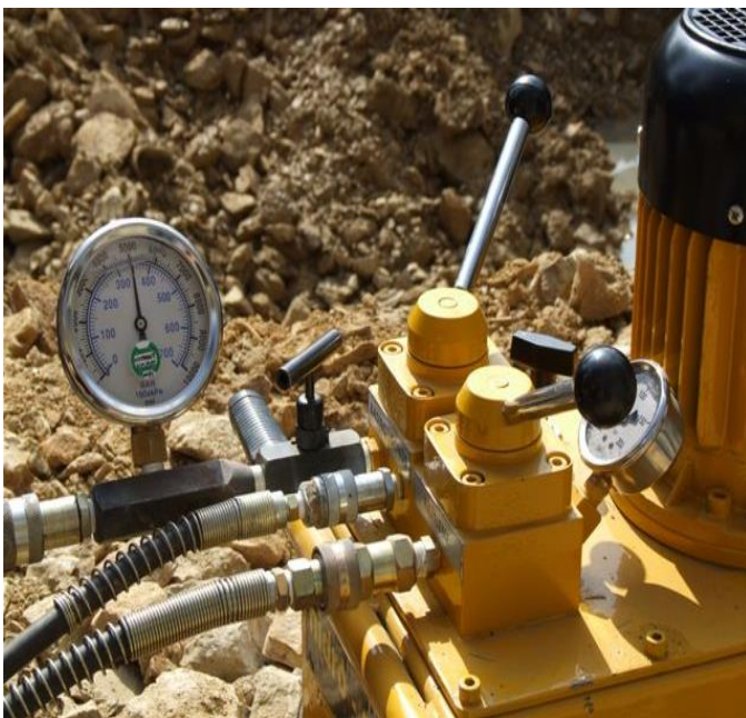
Multi Stressing Power Pack