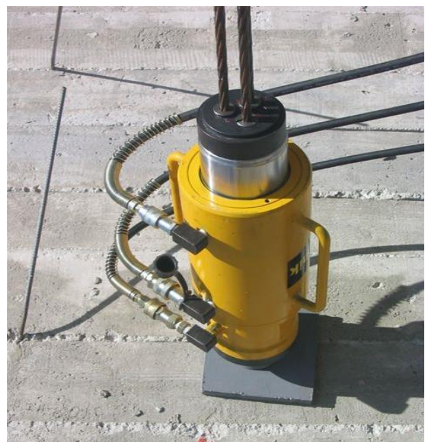
Anchor Multi Stressing Jack